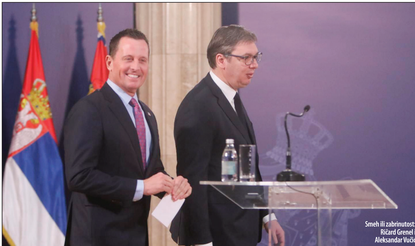
Smeh ili zabrinutost: Ričard Grenel i Aleksandar Vučić